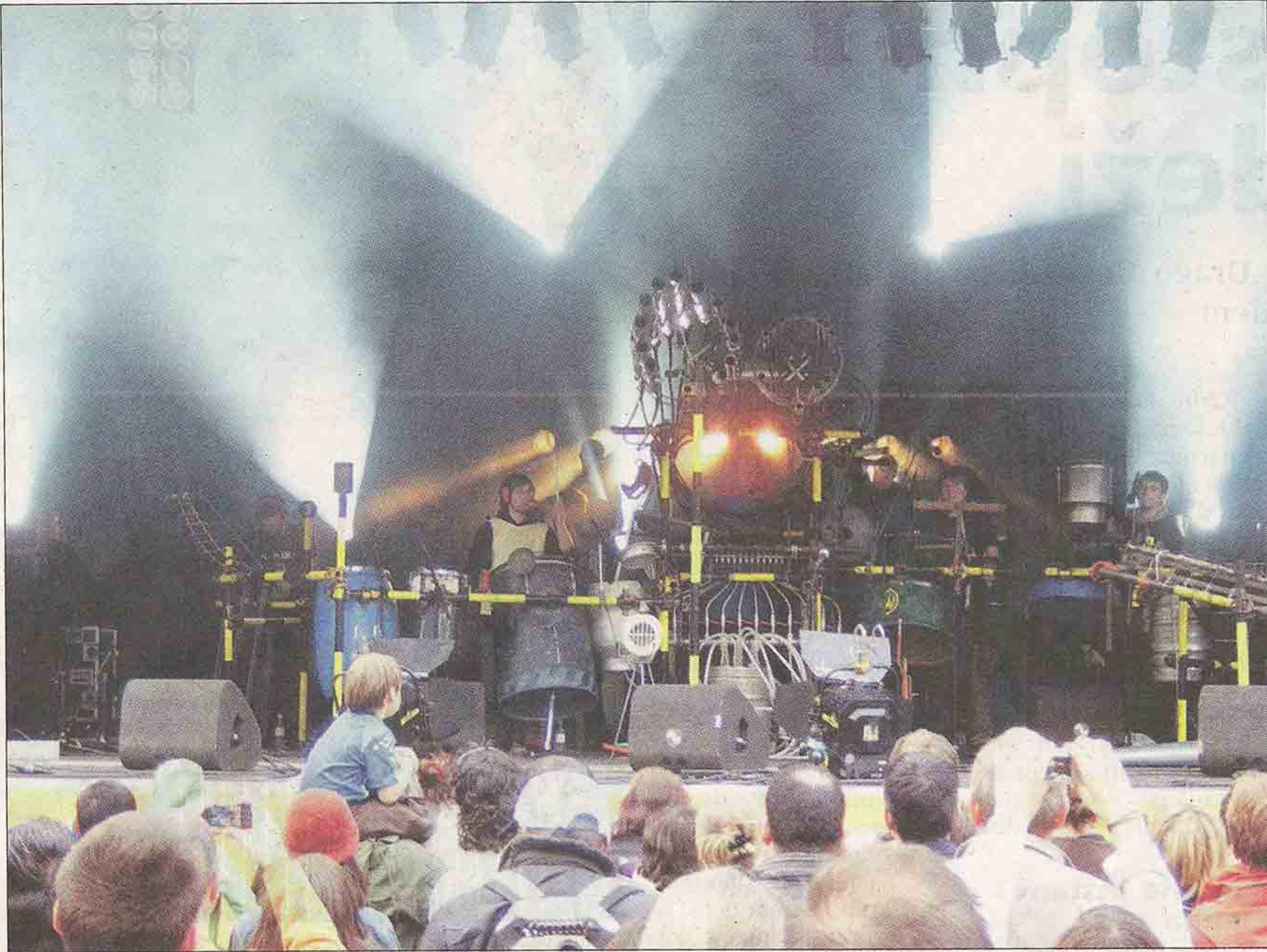
Strojmachine so poleti napolnili trge v Bruslju, Talinu in Rigi.